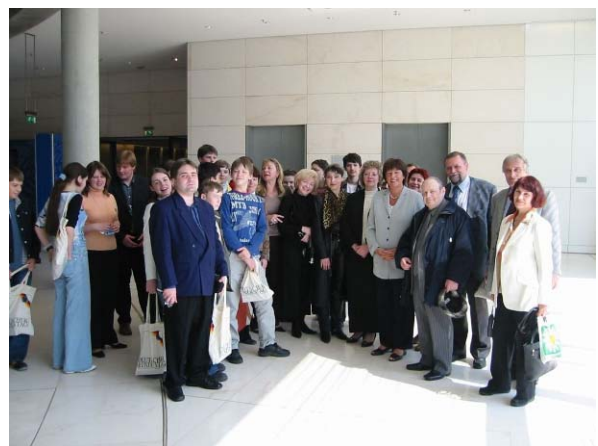
1. Moskauer Schüler treffen Ulla Schmid, (MdB) im Reichstag

(unabhängig von dem generellen Aufgabenziel wurde durch die Bekanntmachung des Projektes Lernende Region eine Kooperationsvereinbarung eines einheimischen Gymnasiums mit einem Moskauer Gymnasium abgeschlossen, die in einem einwöchigen Besuch bei uns am 22. April 2005 ihren Höhepunkt fand)