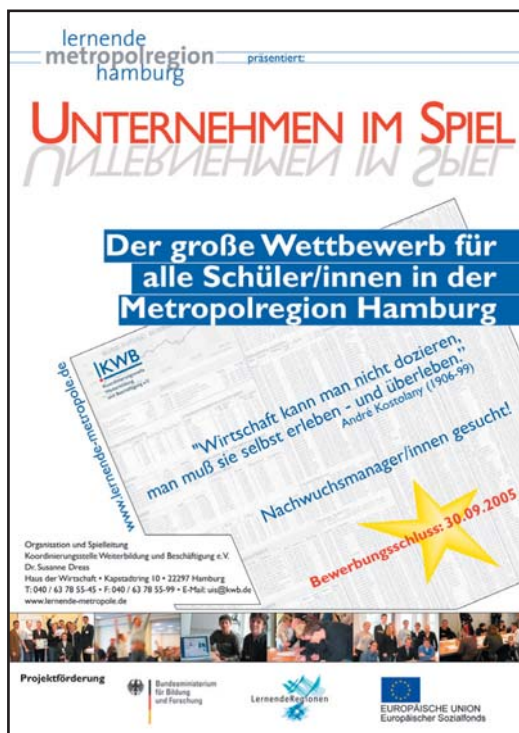
Das Wettbewerbsplakat 2005/06

Eine zusätzliche Motivation stellen sicherlich die zu gewinnenden Preise dar. Auch hier lässt sich eine stetig steigende Bereitschaft bei den Unternehmen der Metropolregion erkennen, diesen Wettbewerb zu unterstützen. Dabei akquiriert die Spielleitung sowohl Sachpreise als auch Betriebsführungen. Die Sachpreise, z.B. Computer oder Buchpreise, sind nicht nur für die Gewinnerteams bestimmt, sondern dafür gedacht, an der Schule zu bleiben, um somit der gesamten Schülerschaft zur Verfügung zu stehen.