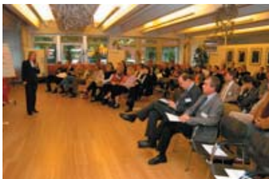
Abschlussveranstaltung „Flexible Qualitätsentwicklung“

Der Arbeit in den Kooperationsprojekten als einem zentralen Element des Projekts widmete sich die Abschlussveranstaltung des zweiten Durchlaufs am 15. April 2005. Hier wurden die Ergebnisse von fünf Kooperationsprojekten vorgestellt, in denen sich die Beteiligten mit Themen wie „Befragung freier Mitarbeiter/innen“, „Qualität im Bildungsmarketing“ oder dem „Einsatz der Balanced Scorecard“ beschäftigt hatten.