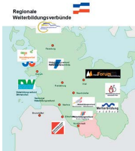
Weiterbildungsverbände in Schleswig-Holstein

Seit 2001/2002 sind vier Lernende Regionen Netzwerke in Schleswig-Holstein hinzugekommen. Hierzu zählen die Netzwerke Lernverbund Norderstedt, Lernnetzwerk Drei-Länder-Eck und Lernendes Neumünster und die lernende metropolregion hamburg . Die lernende metropolregion hamburg ist aufgrund ihrer länderübergreifenden Aufstellung sowohl in Hamburg als auch in Schleswig-Holstein in die bestehenden Netzwerkstrukturen eingebunden. In Schleswig-Holstein sichern regelmäßige Arbeitstreffen der Weiterbildungsverbände und Lernenden Regionen gute Kooperations- und Arbeitsbeziehungen. Projektaktivitäten werden aufeinander abgestimmt, um Synergien zu nutzen. Die landesweite Fachtagung der Weiterbildungsverbände, die am 04. November 2005 in Rendsburg stattfand ist ein gutes Beispiel für die erfolgreiche Zusammenarbeit.