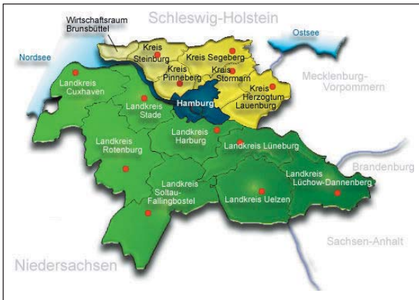
Die Metropolregion Hamburg