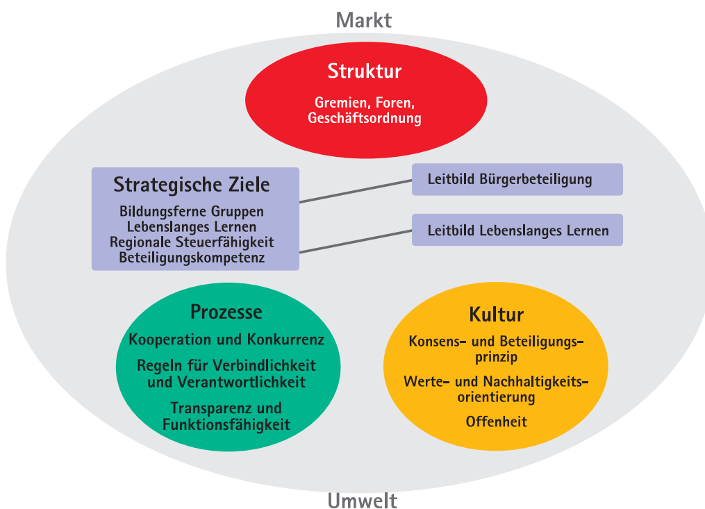
Entwicklungsmodell einer neuen Lernstruktur in Unna

Dieses Grundverständnis einer Arbeit im ZIB-Netzwerk wird Bestandteil der Kooperationsvereinbarung und Gegenstand des Diskurses im Netzwerk. Der in diesem Grundverständnis enthaltene Anspruch führt über den Weg der Definition (und laufenden Redefinition) von Zielen und die Schaffung zieladäquater Strukturen der Kooperation im Netzwerk, zur Gestaltung von Prozessen in Projekten, die sich letztlich in einer neuen Kultur des Lernens widerspiegeln. Die vorliegende Einigung zum Grundverständnis einer neuen Lernkultur im Netzwerk ist ein wesentlicher Meilenstein für die Entwicklung einer nachhaltigen Netzwerkkooperation in der Durchführungsphase und darüber hinaus. Sie ist das Ergebnis eines erfolgreichen Diskurses zwischen den AkteurInnen und trägt wesentlich zu ihrer Identifizierung mit dem Netzwerk bei.