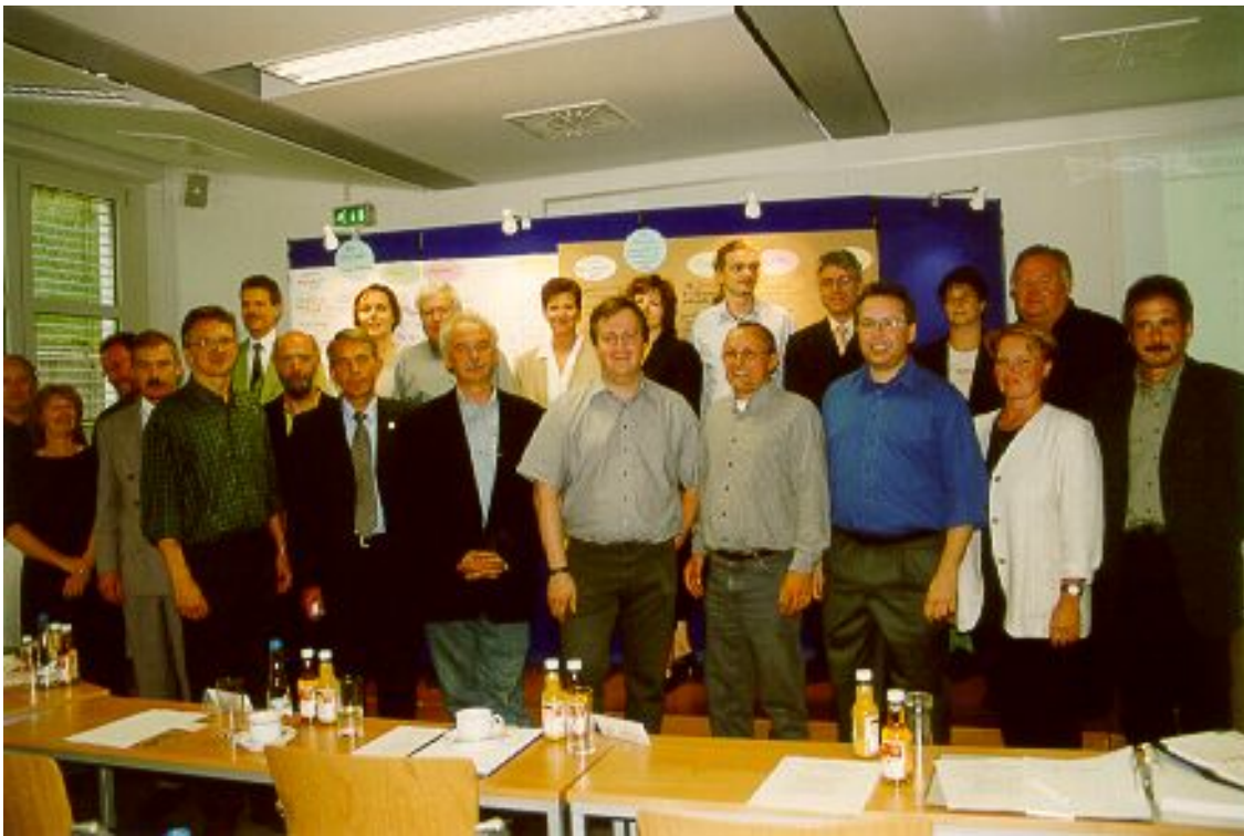
Abbildung 2: Die Netzwerkmitglieder der ersten Stunde beim Arbeitsworkshop!!!

Parallel wurden die sogenannten strategischen Kernteamsitzungen durchgeführt, in der v.a. die künftige Aufbaustruktur des Netzwerkes und die strategischen Fragen im Hinblick auf Marketing und Qualitätssicherungsgrundsätze diskutiert wurden. Zu den strategischen Partnern gehören die IHK, die HWK, die Arbeitskammer und das Kultusministerium, so dass Promotoren aller Bildungsbereiche vertreten waren. Grundsätzliche Entscheidungsprozedur für die spätere Durchführungsphase war ein zweistufiges Verfahren. In der ersten Stufe soll das Arbeitsteam gemeinsam eine Fülle von Maßnahmen erarbeiten, die in ein Gesamtkonzept eingebunden werden und die Programmziele erfüllen müssen. Im Verlaufe der Workshops wurden die Maßnahmen zusammengefasst und eine überschaubare Anzahl von Teilprojekten und Teilnetzwerken gebildet, finanziell bewertet und in die zweite Stufe geschickt. Auf dieser Stufe wurde dann vom Kernteam die regionale Bedeutung eingeschätzt und der finanzielle Rahmen der einzelnen Teilnetzwerke festgelegt. Oberstes Gebot war hier, dass Niemand aus dem Netzwerk „gekickt“ werden sollte.