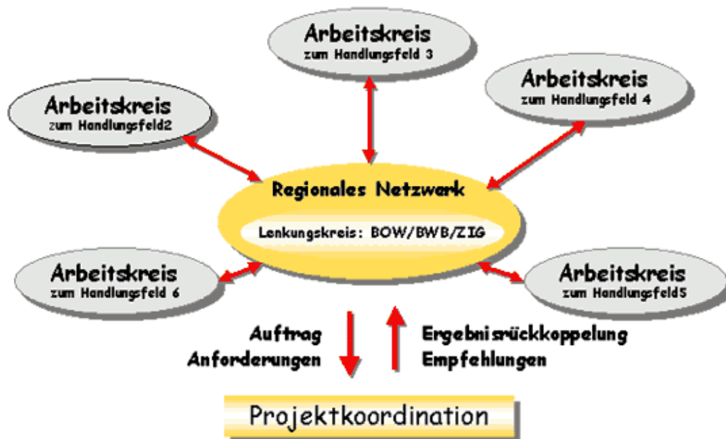
Schaubild: Netzwerkorganisation und Steuerung

Die sechs Arbeitskreise , bestehend aus Fachleuten der jeweils beteiligten Einrichtungen, konkretisierten Projektideen, die im Rahmen der vierjährigen Durchführungsphase zu marktfähigen Bildungsprodukten und Bildungsinnovationen entwickelt werden sollen.