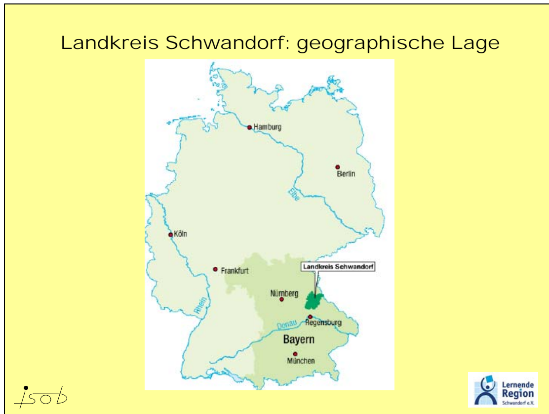
Abb. 1: Geographische Lage des Landkreises Schwandorf

Die Lernende Region Schwandorf umfasst räumlich den Landkreis Schwandorf, der im Grenzgebiet der Ost-Erweiterung der Europäischen Union an der Grenze zu Tschechien liegt (siehe Abbildung 1).