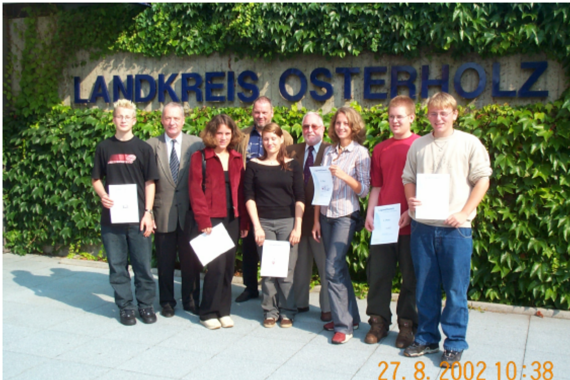
Pressetermin mit den Siegern des Logo- Wettbewerbs

Über 100 Logovorschläge wurden innerhalb weniger Monate eingereicht. In einer nun folgenden Ausstellung präsentierte das Projektleitungsteam der Öffentlichkeit im Forum der Landkreisverwaltung eine Vorauswahl der besten Logos und informierte Bürgerinnen und Bürger gleichzeitig über die Inhalte, Ziele und aktuelle Sachstände „ihres“ Osterholzer Projekts „Lernenden Regionen – Wir lernen im Landkreis Osterholz“.