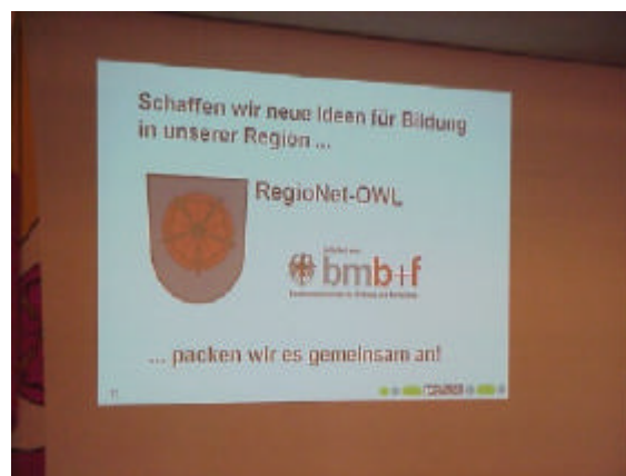
Vision und Motivation - RegioNet-OWL steht für Kooperation und Innovation der Bildungslandschaft in Ostwestfalen-Lippe

Es ermöglicht einen Prozess- und Ergebnistransfer in andere Handlungsfelder. RegioNet-OWL stellt eine Kommunikationsdrehscheibe für eine innovative bildungsbereichs-, träger- und branchenübergreifende Kultur des Lernens dar.