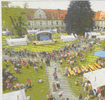
Tausende von Menschen schlenderten am Samstag durch den Benediktbeurer Klosterhof zum dritten Mal ein Lernfest stattfand.