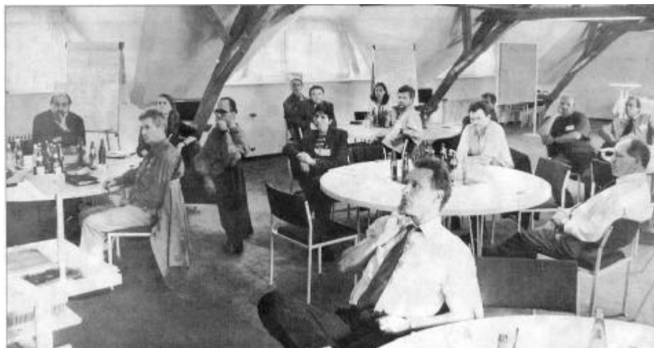
Foto: Auftaktveranstaltung Planungsphase in den Räumen der VHS Balingen, 18.07.2001

September 2001 bis Oktober 2001: Start der Teilprojektentwicklung. Das Konzeptteam aus Experten/innen des GiMA-Berater- und Trainernetzwerks diskutiert die Projektideen und strategische Fragen hinsichtlich der Förderkriterien des BMBF sowie der Stärken und Schwächen der Region: Wo wollen wir hin? Wer sind unsere Zielgruppen? Wer kann Teilprojektleiter sein, wer „Treiber“, wer unterstützender Partner? Erfüllt die Idee die wesentlichen Kriterien des BMBF? Erstellung der ersten schriftlichen Ideen-Skizzen, die der Projekt-Steuerungsgruppe zur Auswahl vorgelegt wird.