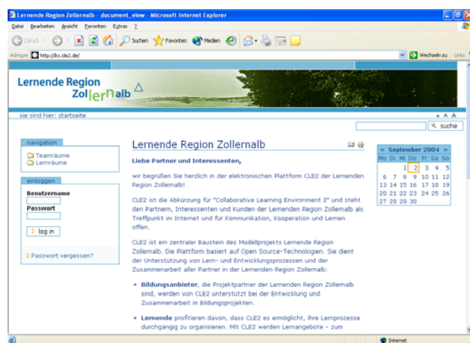
Bild: Startseite der Lern- und Kommunikations-plattform der Lernenden Region Zollernalb

Offenbach der programmweiten Öffentlichkeit vorgestellt.