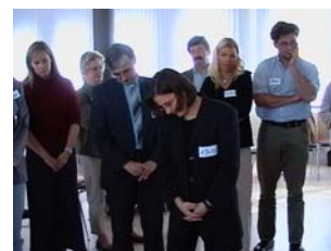
Die Arbeitsatmosphäre war geprägt von Anstrengungen, Erwartungen und einer engagierten Beteiligung.