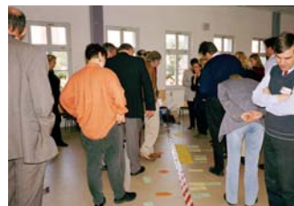
Am Zeitstahl der Planungsphase und deren Verlängerung um fünf Monate erarbeiteten die Netzwerkpartner die Meilensteine im Abgleich zur Beantragung.